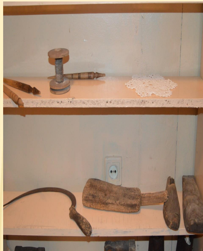
Предметы крестьянского быта